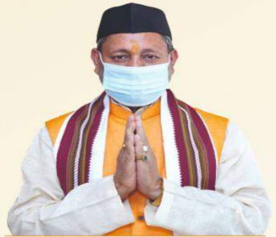
तीरथ सिंह रावत मुख्यमंत्री, उत्तराखण्ड

कृपया सहयोग प्रदान करने के लिए सरकार के निम्न पोर्टल पर अपना पंजीकरण करायें