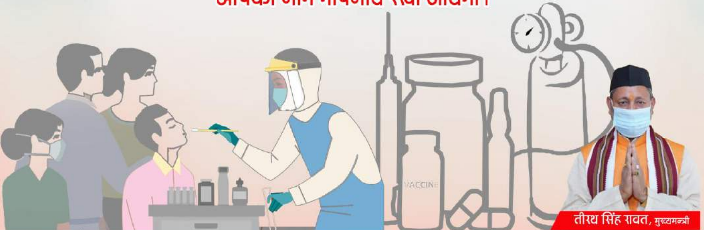
तीरथ सिंह रावत, मुख्यमन्त्री

कोई भी शिकायत करने के लिये टोल फ्री नम्बर-112 0135-2656202 तथा 9412029536 पर सूचित करें आपका नाम गोपनीय रखा जायेगा।