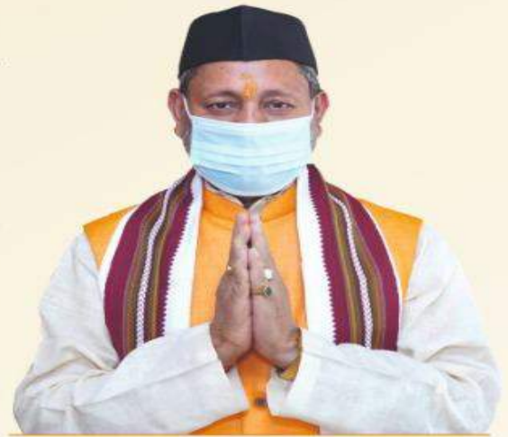
तीरथ सिंह रावत मुख्यमंत्री, उत्तराखण्ड

कृपया सहयोग प्रदान करने के लिए सरकार के निम्न पोर्टल पर अपना पंजीकरण करायें